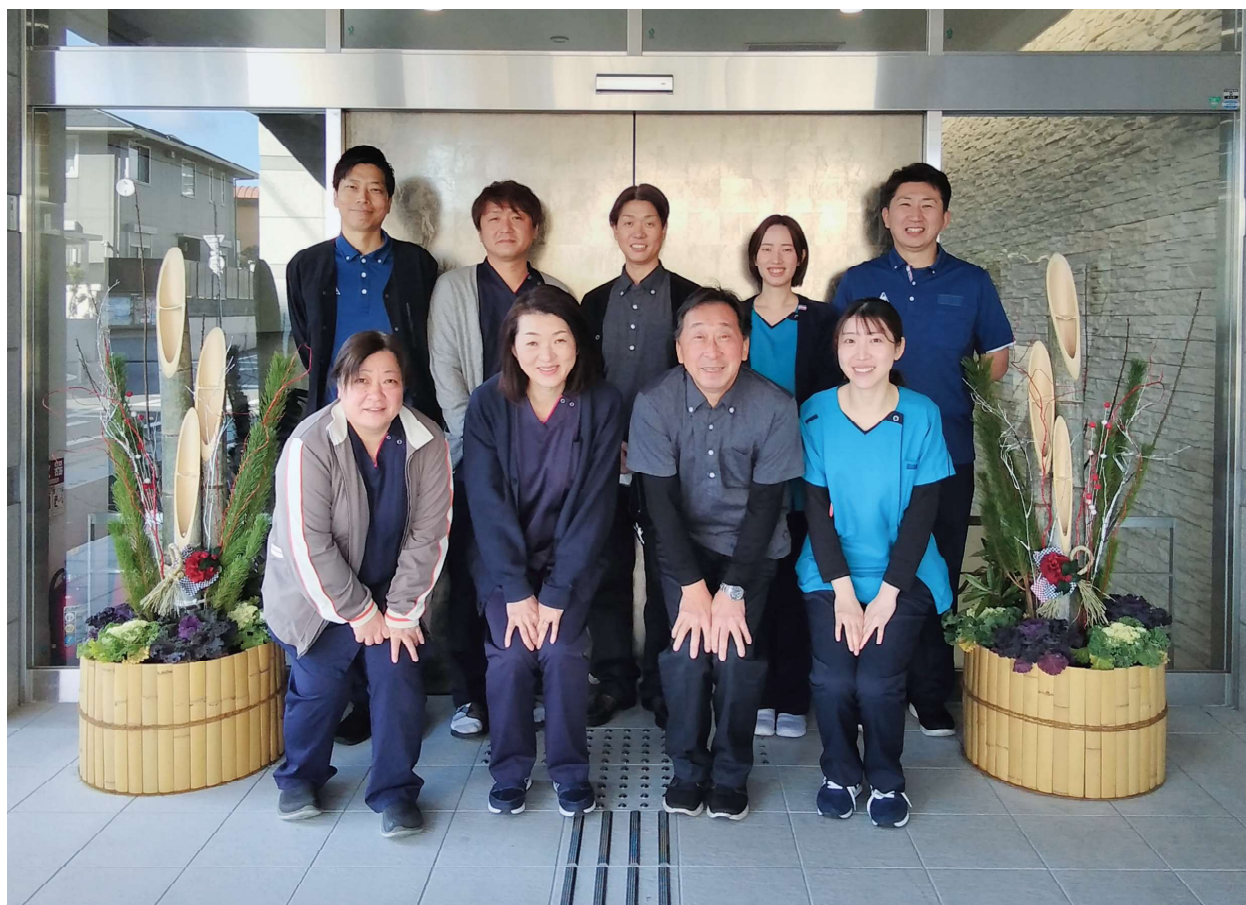
写真：シルバーピア水前寺 スタッフ